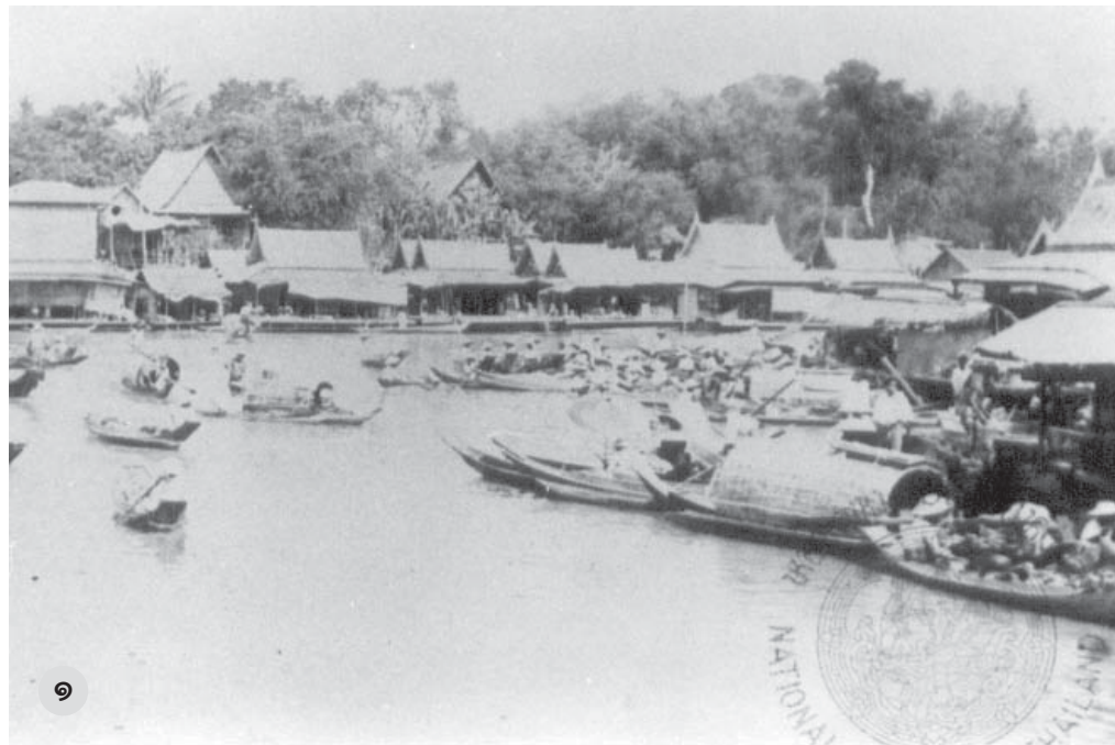
๑. สภาพบ้านเรือนริมน้ำ ด้านหน้าพระราชวังจันทน์เกษม เมื่อครั้งที่ยังเป็นมณฑลกรุงเก่า

พ.ศ. ๒๔๓๖ สมเด็จฯ กรมพระยา ดำรงราชานุภาพ ได้ตรัสชวนให้ไปรับราชการ ในกระทรวงมหาดไทย โดยเริ่มจากตำแหน่ง เสมียนเอกมีหน้าที่เป็นครูฝึกหัดนักเรียนที่จะ ไปรับราชการตามหัวเมืองต่างๆ