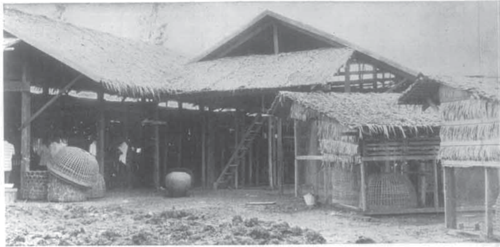
บ่อนปลากัดพื้นเมืองมีลักษณะโดยทั่วไปดังเห็นในภาพนี้