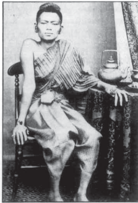
หญิงไทยสมัยรัตนโกสินทร์ยุคต้น ยุคที่ท่านสุนทรภู่มิชีวิตอยู่ ซึ่งท่านได้กล่าวถึงในสุภาวชิตสอนสตรี

“อันความรักของชายนี้หลายชั้น เขาวัวรักรักนั้นประการใด