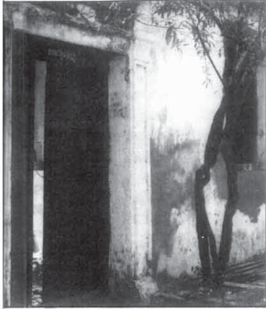
คณะสุนทรภู่ในบริเวณวัดเทพธิดาราม สร้างขึ้นเป็นที่ระลึกในการที่ท่านเคยจำพรรษาขณะครองสมณเพศ

จนกระทั่งปลายรัชกาลที่ ๓ พระบาทสมเด็จพระปิ่นเกล้าเจ้าอยู่หัว เมื่อยังทรงดำรงพระยศเป็นสมเด็จพระเจ้าน้องยาเธอ เจ้าฟ้ากรมขุนอิศเรศรังสรรค์ ทรงปรานีสุนทรภู่ จึงโปรดฯ ให้ไปพำนักอยู่ที่วังหลังอันเป็นที่ประทับของพระองค์