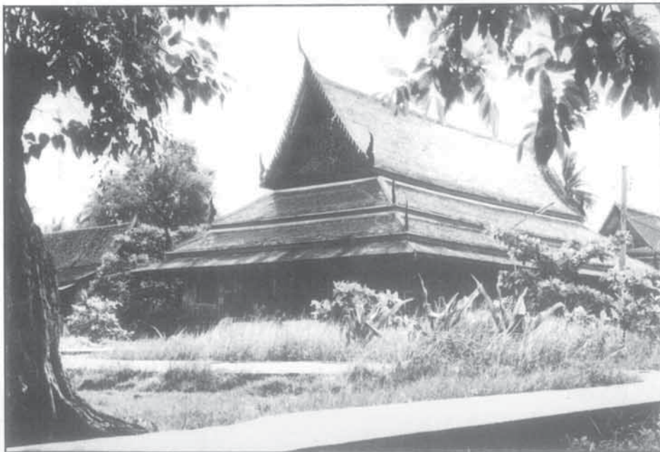
บนซ้าย : พระบาทสมเด็จพระพุทธเลิศหล้านภาลัย ทรงโปรดสุนทรภู่มาก โปรดเกล้าฯ ให้เป็นที่ขุนสุนทรโวหาร บนขวา : วัดกุเซาทอง ในนิราศกุเซาทอง มีอายุเก่าแก่ถึง ๕๘๗ ปี ปัจจุบันเป็นโบราณสถานสำคัญแห่ง